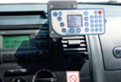
Mobile Zeiterfassungsgeräte, in diesem Beispiel ein Timeboy der Firma Datafox, können über eine Docking Station im Fahrzeug oder mobil direkt auf der Baustelle betrieben werden. Stempelungen sind auf Projekte möglich. Die Daten werden über eine integrierte SIM-Karte direkt an das Hauptsystem im Büro übertragen. Dadurch sind tagesaktuelle Auswertungen mit Live-Daten möglich.

Worauf Sie bei der Einführung eines digitalen Zeiterfassungssystems achten sollten, und warum die Qualität der Integration in Ihre Branchensoftware so entscheidend ist ... von Tobias Funken