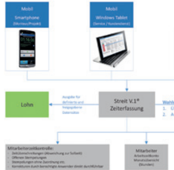
Je besser eine Zeiterfassungslösung mit Ihrer kaufmännischen Software verzahnt ist, desto mehr Synergie-Effekte ergeben sich. Arbeitszeitkonten werden so automatisch für Mitarbeiter, Pro-

Bei der Anschaffung eines Zeiterfassungssystems gibt es einige Aspekte zu beachten, die für eine reibungslose Einführung und eine hohe Akzeptanz bei Mitarbeitern ebenso wichtig sind, wie für einen größtmöglichen betriebswirtschaftlichen Effekt (siehe Kasten „CHECKLISTE“). Man sollte das