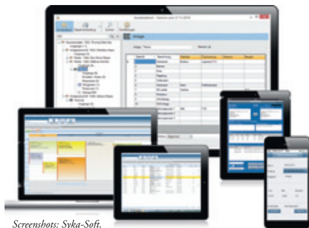
Zeiterfassung mobil und im Büro

Die mobile Zeiterfassung kann als eigenständige Lösung oder als Ergänzung zur sykasoft Branchensoftware genutzt werden. Die Online-Kommunikation läuft über abgesicherte HTTPS-Verbindungen bei einem Level-3-zertifizierten deutschen Provider