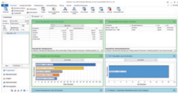
Das Dashboard ermöglicht den Mitarbeitern, die für ihre Belange relevanten Informationen direkt beim Öffnen des Programms auf einen Blick zu erfassen.