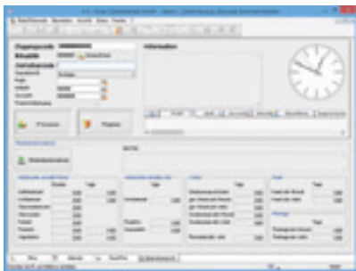
Mitarbeiter im Büro können direkt über die stationäre Zeiterfassung stempeln. Planer und Kalkulatoren buchen ihre Arbeitszeiten beispielsweise automatisch auf die entsprechenden Projekte. Kostenträgerauswertungen in der Betriebsbuchhaltung repräsentieren dadurch die tatsächlichen Aufwendungen für ein Projekt.

Handwerker aus dem Bauhaupt- und -nebengewerbe wissen: Jede nicht dokumentierte Arbeitsstunde ist verlorener Umsatz. Rapportzettel gehören deshalb von jeher zur Ausstattung der Monteure. In Zeiten knapper Kalkulationen, elektronischer Datenverarbeitung und digitaler Büroorganisation bergen sie jedoch immense betriebswirtschaftliche Risiken. Der Umstieg auf eine digitale Erfassung der Arbeitszeit merzt die meisten dieser Risiken aus. Ist die Zeiterfassung darüber hinaus hochintegrierter Bestandteil der kaufmännischen Software des Betriebes, wird sie dank bestmöglicher Verzahnung zu einem effizienten Werkzeug für die gesamte Betriebsorganisation. Bleibt trotz voller Auftragsbücher am Ende des Geschäftsjahres nicht genug hängen, gilt es, die Gründe dafür zu identifizieren und abzustellen. Oft sind einfach nicht alle Stunden sauber dokumentiert, die geleistet wurden. Stundenzettel erzeugen viel Nacharbeit, verschwinden gerne oder werden unvollständig ausgefüllt.