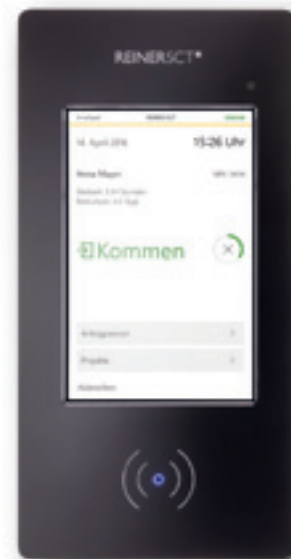
timeCard Multiterminal touch

Der Multiterminal touch ist ein elegantes Terminal, das – um zusätzliche Komponenten erweitert – Zeiterfassung und Zutrittskontrolle gleichzeitig übernimmt. Für die Installation sollte man sich am besten einen dicken Schraubenzieher bereitlegen, da für die Führung von Strom- und Netzkabel einige Abdeckungen auszubringen sind. Der Netzwerkstecker ist etwas unglücklich verbaut. Ohne Hilfsmittel ist es im Nachhinein nicht möglich, das Kabel wieder zu lösen. Das Problem lässt sich allerdings leicht umgehen, indem man das Terminal kabellos per WLAN in das Firmennetz integriert. Das 8-Zoll Touch-Screen-Display ist kontrastreich und hinterlässt – wie das gesamte Gerät – einen qualitativ hochwertigen Eindruck.