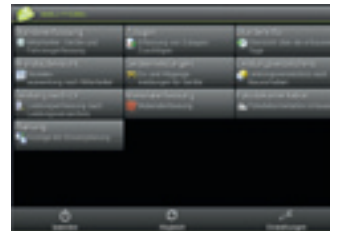
bau-mobil setzt sich aus einer Bürosoftware und einer modernen App für mobile Endgeräte zusammen.

Gegründet im Jahre 1901 als Pflastererbetrieb, hat sich die RAEDER Straßen- und Tiefbau GmbH zu einem modernen und leistungsstarken Bauunternehmen entwickelt. Neben klassischen Straßenbautätigkeiten sowie Kanal- und Erdbauarbeiten umfaßt das Portfolio von RAEDER auch schlüsselfertige Tiefbauleistungen. Das Unternehmen mit Stammhaus in Mönchengladbach beschäftigt rund 60 Mitarbeiter, darunter acht Ingenieure sowie acht Meister. RAEDER ist anerkannter Ausbildungsbetrieb für das Straßenbauerhandwerk. Ergänzend zum umfassenden Know-how der Mitarbeiter bilden modernste Maschinen und Geräte für vielfältige Anforderungen und eine IT-Infrastruktur am Puls der Zeit das Fundament für eine qualitativ hohe sowie termingerechte Fertigstellung von Bauprojekten ... von Verena Mikeleit