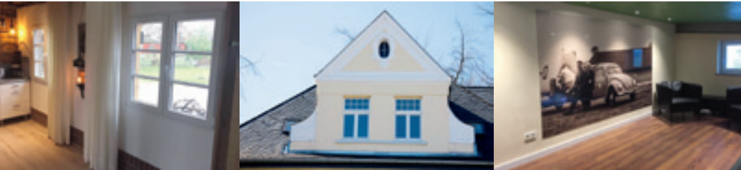
Aus den Referenzen auf der Webseite der Firma Sparding

Gewißheit, daß bei korrekter Nutzung durch die Mitarbeiter keine aufwendige Nachkontrolle nötig ist. Der Funktionsumfang von „Das Programm“ ist reduziert auf das, was im täglichen Betrieb wichtig ist, und flexibel genug,