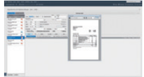
Belege lassen sich bei Lexware financial office 2022 direkt aus dem digitalen Posteingang heraus buchen.

träge, anlegen kann – und das auch auf der Einkaufsseite. Die Buchhaltung arbeitet belegorientiert. Digitale Dokumente werden von einer KI analysiert. Das gelingt nicht so gut wie beim Wettbewerber Lexoffice, dennoch ist das Ergebnis akzeptabel. Weitere Pluspunkte sind Anlagenverwaltung und Onlinebanking. Die Apps für mobile Geräte laufen derzeit nur auf dem Smartphone, nicht aber auf Tablets. Schnittstellen existieren zum Steuerberater und aktuell mehr als zwanzig Partner-Apps.