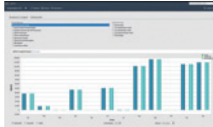
Dashboards informieren in Lexware financial office 2022 über die aktuelle Geschäftssituation.

sevDesk: Der kaufmännische Clouddienst sevDesk umfaßt die beiden Bereiche Auftragsbearbeitung und Buchhaltung, wobei die Bilanzierung nicht unterstützt wird. Geschäftszahlen werden auf einem zentralen Dashboard präsentiert. Der Umfang der Auftragsbearbeitung unterscheidet sich nicht wesentlich von anderen Anbietern – bis auf die Tatsache, daß man wiederkehrende Rechnungen, etwa für langfristige Serviceauf-