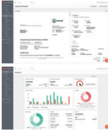
Oben: Die meisten Rechnungsdaten erkennt sevDesk automatisch, sodaß die Buchung wenig Aufwand bedeutet. Unten: Das Management Dashboard von sevDesk gehört zu den umfangreichsten im Test.

debitoor M: Der Clouddienst debitoor ist in vier verschiedenen Varianten buchbar, wobei sich die Versionen L und M lediglich durch die Zahl der Nutzer (1 bzw. 3) unterscheiden. Wer seine Steuererklärung selbst erstellen will, benötigt mindestens die Version M, da die kleineren Pakete keine Umsatzsteuervoranmeldung unterstützen. Zum Leistungsspektrum gehören Auftragsverwaltung, Buchhaltung und Onlinebanking. Ebenso wie die beiden Wettbewerber arbeitet debitoor belegorientiert. Digitale Belege finden entweder via Smartphone-App oder per Direktimport ihren Weg in die Buchhaltung. In Sachen Auswertungen liefert debitoor M neben der obligatorischen EÜR auch die GuV. Komfortabel ist der Abgleich zwischen Buchhaltung