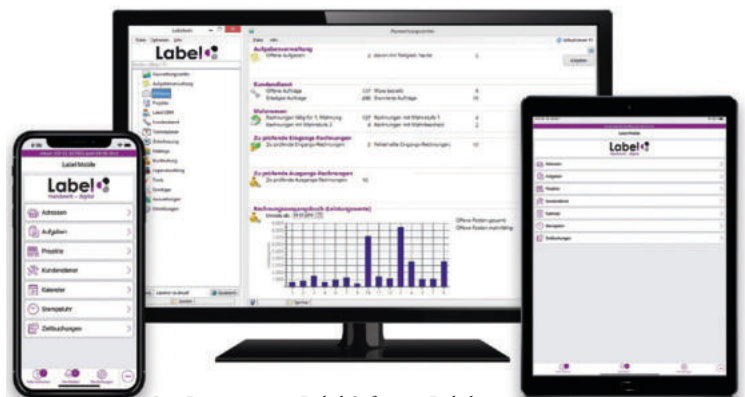
Die Lösungen von Label Software: Labelwin und Label Mobile.

Mobiles Arbeiten im Handwerk führt zu zufriedenen Kunden und Mitarbeitern. Die Firma H. Knapmeier GmbH aus Bielefeld macht es vor: dank Einführung einer mobilen App für den Kundendienst wurden Prozesse optimiert, Zeit eingespart und die interne und externe Kommunikation verbessert ... | VON NORA BAX