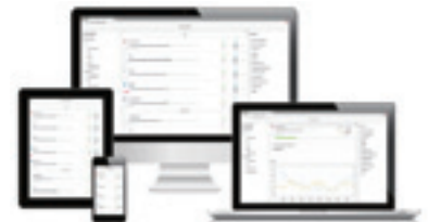
Mit der heizManager-Kalenderapp läßt sich die Heizung über Smartphone, Tablet oder PC steuern.