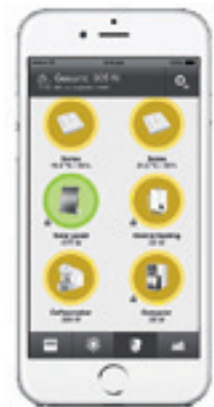
Die Plugwise App ist für Smartphone, Tablet- oder Windows-Computer erhältlich.