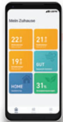
Die neue tado° App für das energiesparende Heizen enthält auch einen „Heizungs-Reparaturservice“, um einen Partner-Installateur in Ihrer Nähe zu verständigen.