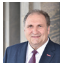
Hans-Peter Wollseifer, Präsident des ZDH