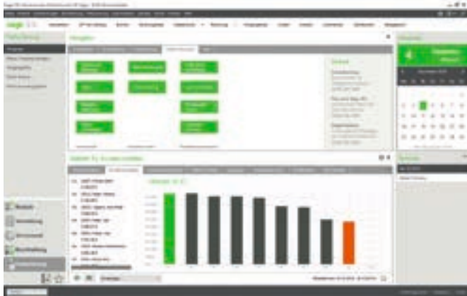
Sage 50 Cloud Dashboard

während die klassischen druckorientierten Berichte mit EÜR und Umsatzsteuer eher dünn besetzt sind. Auf Stammdatenebene ist der Spielraum hingegen ausreichend. Auch SevDesk lässt sich um rund 20 Tools von externen Partnern erweitern, allerdings nicht um Funktionen für Handwerker.