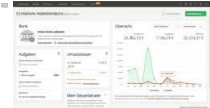
Das Dashboard in lexoffice zeigt wichtige Ereignisse und aktuelle Geschäftszahlen an.