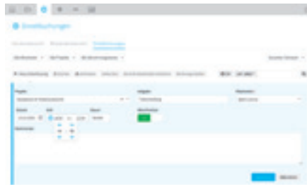
Papierkram umfasst auch Zeiterfassung und Projektverwaltung.

Hinzu kommen Anlagenverwaltung und Mahnwesen, die allerdings beide eher schlank aufgestellt sind. Zu den interessantesten neuen Funktionen gehört das Kundencenter, in dem man zum Beispiel Angebote bereitstellen kann. Nehmen Kunden die Offerte an, informiert Lexoffice per Push-Meldung auf dem Smartphone. Zuletzt hat man den