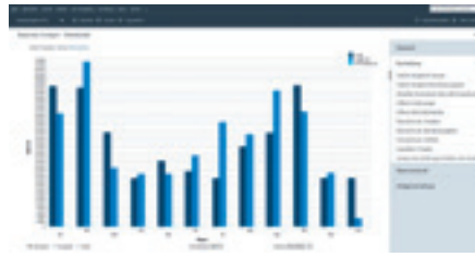
Lexware financial office: Grafische Übersichten geben bei Lexware financial office 2023 Einblick in die Details.

Damit sind fast alle kaufmännischen Disziplinen abgedeckt. Trotz des Funktionsumfangs ist das Tool einfach zu bedienen, was vor allem an der übersichtlichen Benutzerführung und