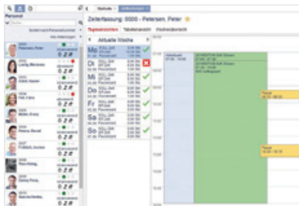
Im Back-Office sieht man auf einen Blick die Anwesenheit der Mitarbeiter. Zudem lassen sich z.B. individuelle Auswertungen erstellen oder Urlaubslisten und Überstunden verwalten.