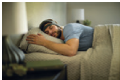
Mit dem Stirnband Smartsleep und zahlreichen Sensoren will Philips Leuten mit Schlafstörungen zu einer besseren Nachtruhe und mehr Erholung verhelfen.

So wurde nach einem Hallenrundgang schnell klar, daß heute jeder Kühlschrank alleine einkaufen kann, daß Lautsprecher und Fernseher mit smarten Assistenten wie Alexa reden und daß letztere Auflösungen von 8K haben. Und nach dem Besuch bei ■ Philips und beim Startup