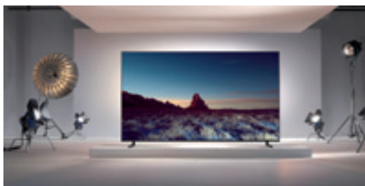
Auf der IFA präsentierte Samsung seinen ersten 8K-Fernseher. Seine Auflösung beträgt unglaubliche 7.680 x 4.320 Pixel, die Bildschirmdiagonale des größten Modells liegt bei 85 Zoll.