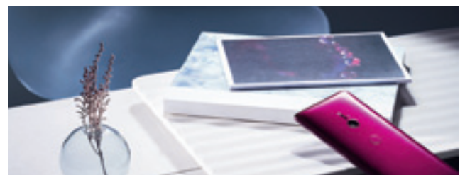
Sony hat das Design der neuen Smartphones überarbeitet und neue, smarte Funktionen in das Mobiltelefon integriert.

Unter dem Funkturm enthüllte auch ■ Sony sein neuestes Smartphone. Das Design haben die Japaner bei dem Xperia XZ3 im Vergleich zu den Vorgänger-Modellen verändert. Das Mobiltelefon