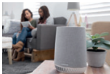
Netgears Orbi Voice Smart Speaker Satellit ist ein Tri-Band WLAN-Router mit integriertem smarten Lautsprecher, der mit Alexa kommunizieren kann.

Hochkonjunktur auf der IFA hatten auch smarte Speaker. Auf Zuruf spielen sie Lieblingssongs ab, schalten die Romantikbeleuchtung für das Abendessen oder die Alarmanlage ein. Mit Google reden zum Beispiel die Lautsprecher von ■ Harman . Premieren feierten auf der IFA unter anderem die Citation-Serie. Auszeichnen sollen sich die schlaun Lautsprecher des zu Samsung gehörenden Soundspezialisten durch ihr modernes Design, den guten Sound und ihre intelligente Sprachsteuerung. Klanglich (und preislich) in einer anderen Liga spielt sicher ■ Blaupunkt mit dem PVA 100. Der WLAN-fähige Steckdosenlautsprecher gibt nicht nur Musik wieder. Vielmehr verwaltet der handliche Speaker dank integrierter Google Sprachsteuerung auf Zuruf tägliche Aufgaben wie Kalendereinträge, Einkaufslisten oder Erinnerungen oder beantwortet Fragen etwa zu Wetter und Verkehr. Auch als Steuerzentrale für das vernetzte Heim ist er einsetzbar.