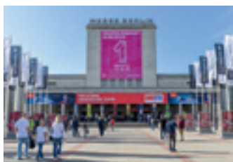
Nächste IFA: 6. – 11.09.2019