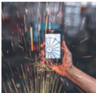
Das Core-X3 ist wasser- und staubdicht (IP68 zertifiziert) sowie stoßfest (MIL-STD-810G)