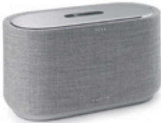
Der schick designte Speaker von harman/kardon versteht sich gut mit Google und steuert auf Wunsch auch das smarte Heim.

Fast alle anderen Fernseher, die auf der IFA nicht mit Megaauflösungen protzten, bieten immerhin 4K-Auflösung und ein immer erreichbares, verständiges Ohr. So arbeiten zum Beispiel sowohl die AF9- als auch die ZF9-Serie von ■ Sony mit Android TV als Betriebssystem. Per Sprachbefehl steht Nutzern Tor zu Inhalten wie Filmen, Musik, Fotos, oder Apps offen. Die ■ Philips Android TVs verstehen sich mit Alexa. So reicht es, im Vorbeigehen mal „Alexa, schalte Wohnzimmer-Fernseher ein“ zu murmeln und schon läuft die Glotze. Gespräche mit Alexa funktionieren aber nur, wenn der Nutzer ein Alexa-fähiges Gerät wie den Amazon Echo oder den Echo Spot einsetzt.