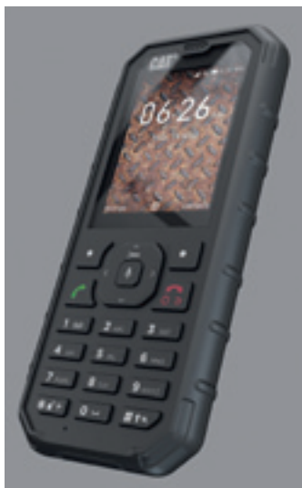
Cat B35 ist sturzfest, staub- und wasserdicht und wurde für den Einsatz in rauen Umgebungen entwickelt.