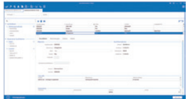
pds Werkzeug App

Im Innendienst ermöglicht die Werkzeug- und Geräteverwaltung eine komfortable Rundumsicht auf die im Umlauf befindlichen Betriebsmittel und Arbeitsgeräte: Als vollständige Historie der Reservierungen, Entnahmen, Rücknahmen samt Zuordnung zu Vorgängen,