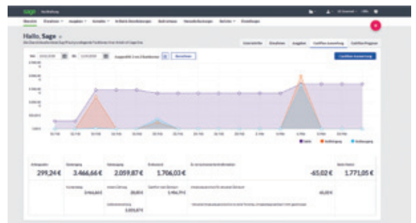
Screen oben: Sage 50 Cloud liefert gleich beim Start einen umfassenden Überblick über die aktuelle Situation.