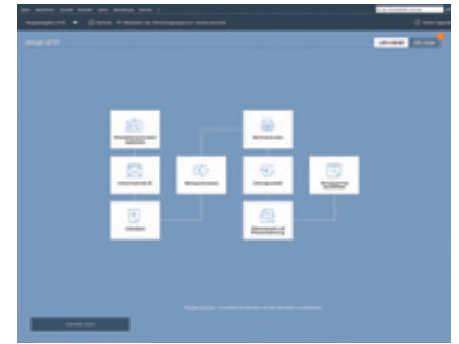
Lexware financial office: Auf der aufgeräumten Programmoberfläche von Lexware financial office finden sich auch Einsteiger schnell zurecht.

monatliche Gebühr abgerechnet werden. Je mehr Extras, desto höher die Betriebskosten. Wichtige Zusatzfunktionen sind etwa Lager, Projektverwaltung oder Handwerk. Über die letztere Funktion lassen sich Artikel aus DATANORM-Kataloge importieren. Ebenfalls an Bord ist eine mobile Version, mit der man Angebote und Rechnungen erfassen kann. In Sachen Buchhaltung beherrscht Mein Büro ausschließlich die EÜR. Für den elektronischen Datenaustausch mit dem Finanzamt ist ein Zusatzmodul erforderlich – so etwas gehört eigentlich zur Basisausstattung. Ansonsten arbeitet die Software belegorientiert, ist übersichtlich und damit auch für kaufmännische Einsteiger leicht zu erlernen.