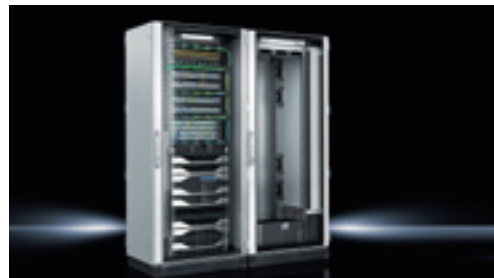
Edge Data Center von Rittal

Gewährleistung und Abrechnung des Tankens von Strom oder Reservierens von Parkplätzen. Zahlreiche Anbieter in Halle 12, wie Alcatel-Lucent, Auerswald, Lancom, NFON, Placetel, Snom oder Telefonica (nach 10 Jahren wieder mit großem Messestand auf der CeBIT) bieten Lösungen, mit denen Kunden entweder komplett mit einer virtuellen Telefonanlage in die Cloud wechseln oder aber durch einen Router die bisherige Telefonanlage auch ohne ISDN-Anschluß weiter im digitalen Telefonnetz nutzen und auch das lieb gewonnene Faxgerät weiterbetreiben können. ■ eQ-3 aus Leer mit seinen Homematic Produkten nutzt zum Teil auch Telefonanlagen oder Handyapps zur Steuerung seiner Geräte, die Heizung und Raumklima, Sicherheit und Alarm, Licht schalten und dimmen oder Fernbedienungen und Taster regeln.