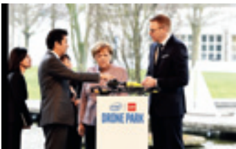
Bundeskanzlerin Angela Merkel und der Japanische Ministerpräsident Shinzo Abe Sushi beim CeBIT-Eröffnungsrundgang im Drohnenpark von Intel.