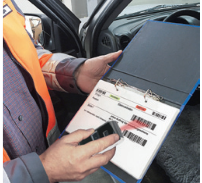
Scanner mobil

■ Regelmäßige Aufgaben wie Instandhaltung oder Wartung als Daueraufträge ■ Planbare und / oder einmalige Aufgaben wie Sanierungen oder Modernisierungen als Einzelaufträge . Die Barcodes werden automatisch beim Ausdruck der Auftragspapiere erstellt. Im Planungskalender kann eine Aufgabe fixiert und der Zeitrahmen für die Erledigung des Auftrags festgelegt werden.