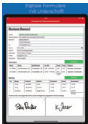
DIGI-FORM – digitale Formulare mit Unterschrift