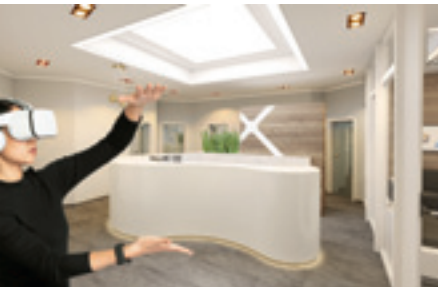
Eine Visualisierung, die in PYTHA erstellt und für die Entwurfspräsentation verwendet wurde.

Die Version 25 der 3D-CAD Software bietet eine Vielzahl von Neuerungen mit dem Fokus auf den Bereich Visualisierung: Denn erst die überzeugende Präsentation beim Bauherrn sichert den Auftrag. Mit